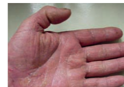
20 Tage später