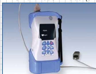
Praktischer Geräte-Schutzschuh mit Aufstellbügel