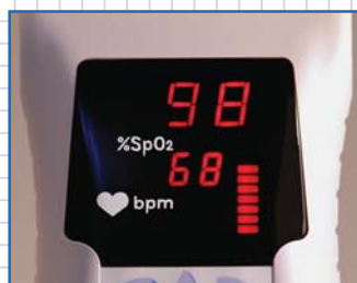
Hell leuchtende LED-Anzeige für Daten und Meldungen