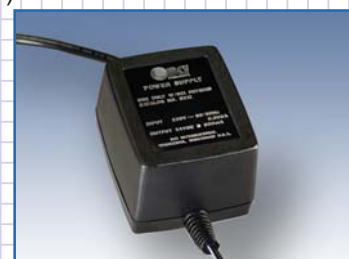
Leistungsstarkes Netz-/Ladegerät für eine Voll-Ladung in 6 Stunden