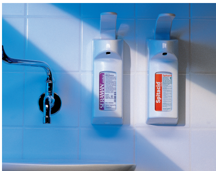
Leichte, hygienische Entnahme mit unserem Dermados-Wandspender