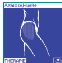
Grafik zum Behandlungsgebiet